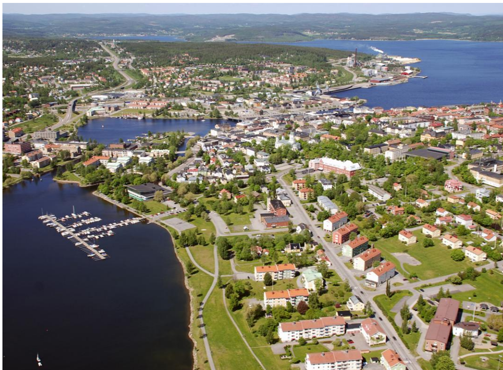
Flygbild över Härnösand.

Avståndet mellan Härnösand och Sundsvall är 53 kilometer, och Sundsvall, Timrå och Härnösand har tillsammans närmare 140 000 invånare, 57 procent av länets befolkning. Följaktligen är pendlingen mellan de tre kommunerna omfattande och ökar stadigt, med påföljd att de enligt såväl SCB:s som Tillväxtverkets definitioner tillsammans med Ånge kommun utgör en sammanhängande funktionell arbetsmarknadsregion (FA-region). E4:an håller på sträckan Härnösand-Sundsvall en i huvudsak godtagbar standard, och bussförbindelserna mellan de tre huvudorterna är, efter norrländska förhållanden, täta. Flaskhalsen i det transportsystem som binder samman de tre orterna är i stället järnvägen, som på sträckan håller en bitvis mycket låg standard. Om denna byggdes ut till samma standard som Botniabanan mellan Härnösand och Örnsköldsvik skulle restiden i det närmaste kunna halveras från dagens (minst 50 minuter). Den aktuella investeringen inryms dock inte i den nu gällande nationella planen och torde tidigast kunna genomföras i slutet av 2020-talet.