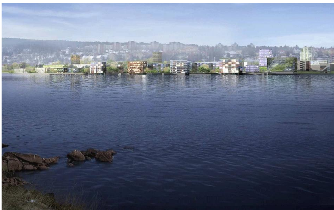
Norra Kajen i Sundsvall.

Så sent som i december 2012 beslutade universitetsstyrelsen att avdelningsstrukturen inom Mittuniversitetet inte ska förändras. Enligt uppgift håller universitetet dock öppet för att kunna ompröva detta beslut, om scenario 4 skulle bli aktuellt.